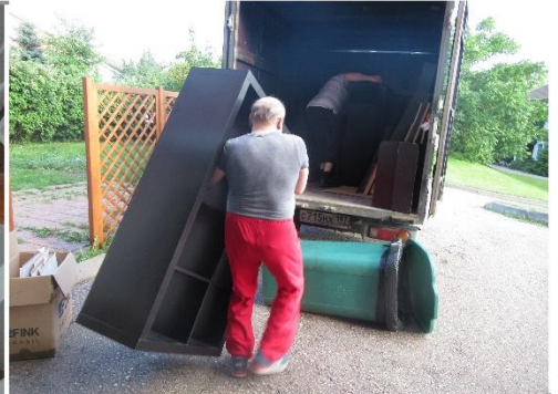
Og så op i bilen