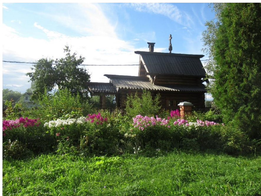
Tur til Troitse-Sergiev-Lavra og til en lille trækirke på landet