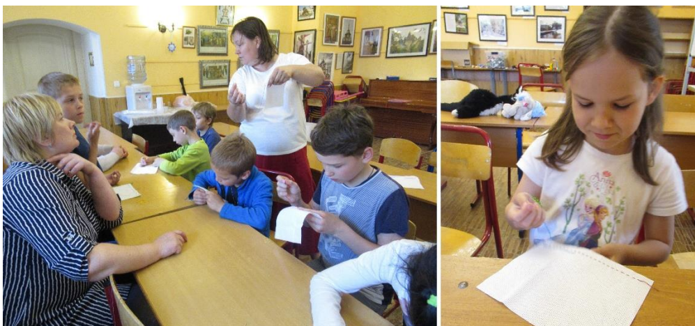
Dagmarskolens Sommerkursus 2018