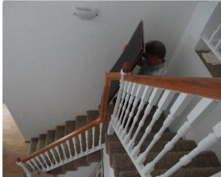
Ad den smalle trappe